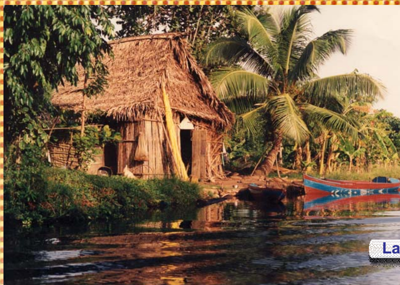
La casa del río

Fuente: Censos de población y vivienda 2001. Cifras ajustadas por omisión censal.