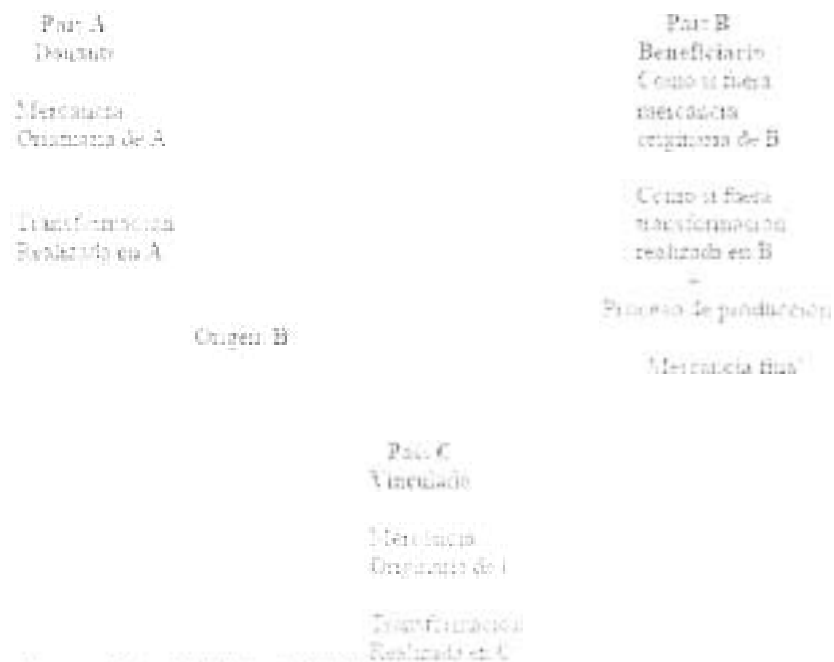
Cuadro N° 1-4 Acumulación multilateral, 2001