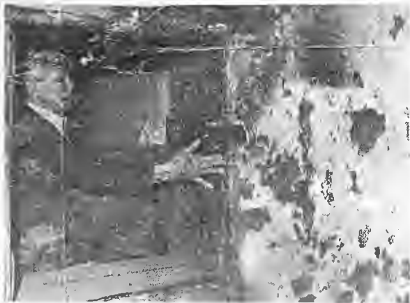
La centenaria casa está en estado ruinoso, pero ADECAS ya gestionó el dinero para arreglarla. (Montenegro)