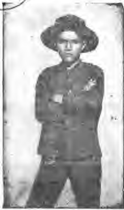
Este chico "retador" es Carlomagno Araya, que ya guataba mirar de frente a la vida...

Hace unos días —el 5 de noviembre— cumplió 68 años el poeta nacional don Carlomagno Araya. LA REPUBLICA quiere rendir por este medio un modesto tributo al magnífico poeta, publicando lo que creemos son sus mejores sonetos, género en el cual se distingue don Carlomagno, y que ha sido siempre su preferido. Felicitamos al poeta y le renovamos nuestro afecto en esta ocasión.