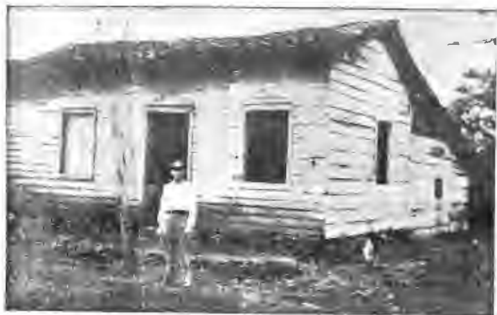
En esta casa de San Ramón nació el poeta, que acaba de cumplir 68 años de edad....