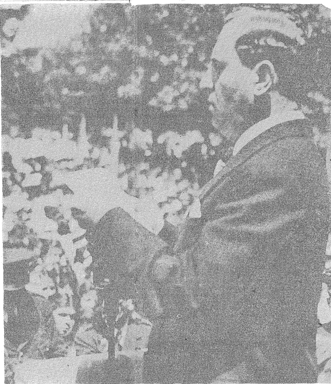
ORADOR. — En 1942, en el Templo de la Música, el Presidente Calderón Guardia, se dirige a los estudiantes en ocasión de la celebración del 15 de setiembre.

del Hospital San Juan de Dios, Cirujano Jefe del Hospital; Vice presidente de la Liga contra el Cáncer, miembro de la Directiva del Sanatorio Durán y Facultad de Medicina.