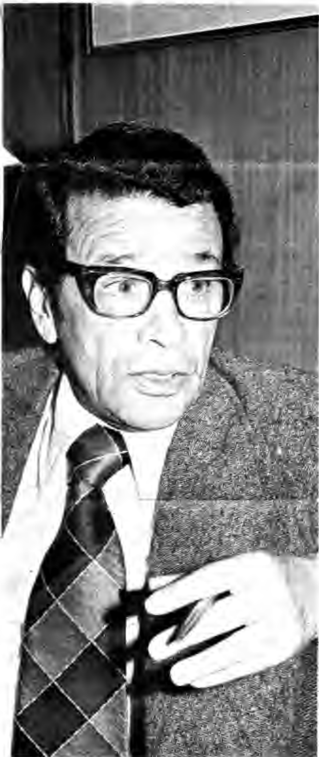
"...nuestros políticos, por distintos caminos y razones, quieren lo mismo..."