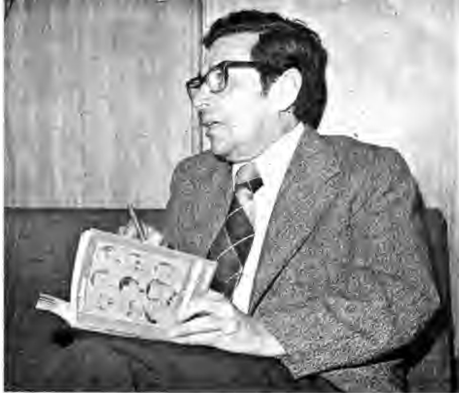
"... lo que me propuse es que los lectores, por medio mío, dialogara con los políticos..."