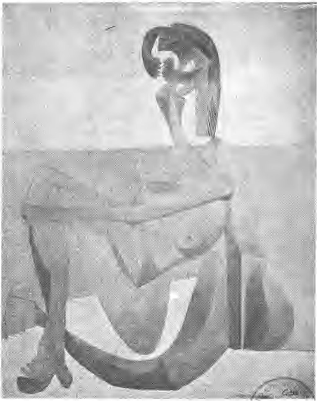
Mujer sentada junto al mar. (1929).