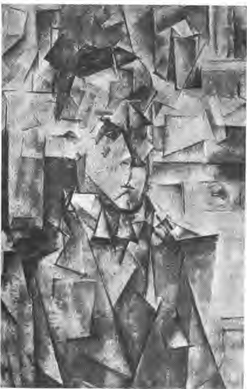
Retrato de Wilhelm Ulde (1910)

“...es la misma inspiración surrealista la que fecunda el arte de Picasso, exaspera su invención y le impulsa a crear un mundo de monstruos, y de fantasmas, de pesadillas tan alucinantes que no se puede escapar a su embrujamiento”.