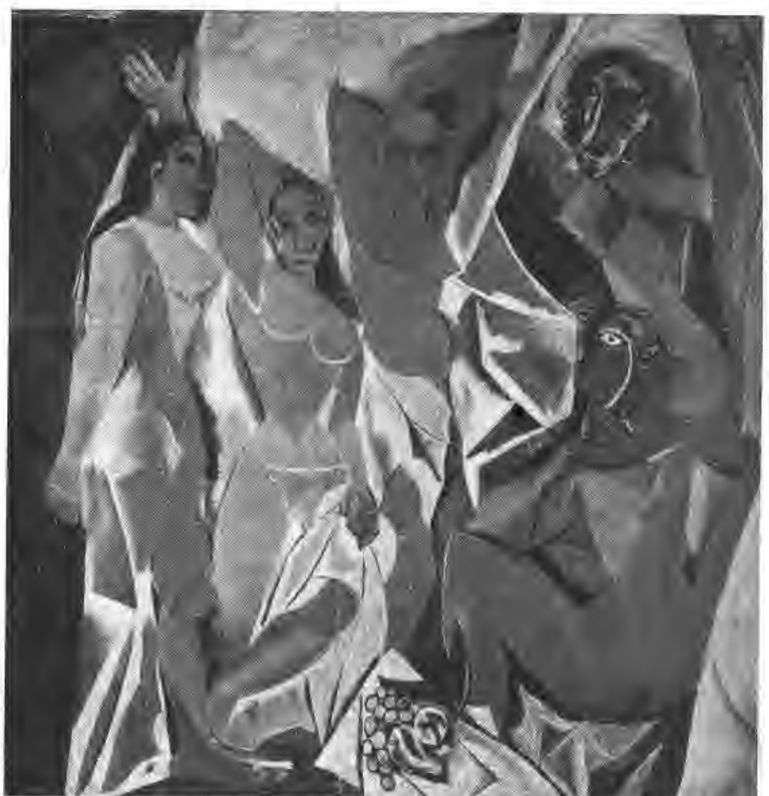
Les demoiselles D'Avignon. (1907)