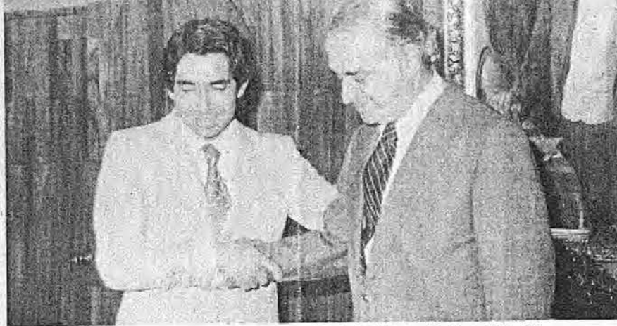
MISION CUMPLIDA: emotiva y muy cordial fue la despedida entre el Presidente de la República y su Ministro de Planificación.