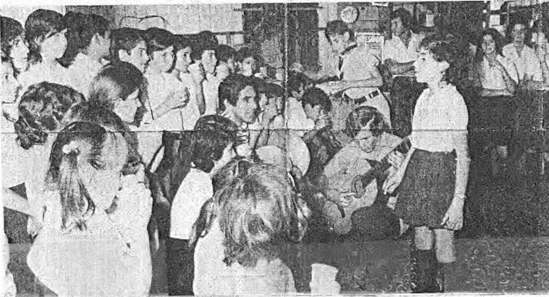
La igualdad de oportunidades para todos los niños es una meta fundamental en la nueva Costa Rica que debemos construir.

ARIAS: -La cruzada por la descentralización efectiva del poder político, el retorno de la preeminencia que corresponde a los gobiernos locales, la búsqueda de una democracia económica. En suma, la continua lucha por alcanzar la democracia participativa, que se ajuste mejor a las condiciones de Costa Rica y en donde los beneficios del desarrollo se puedan distribuir con mayor justicia.