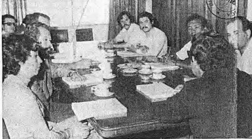
La participación de los sindicatos en el Plan Nacional es garantía para una mejor distribución de los beneficios del desarrollo.