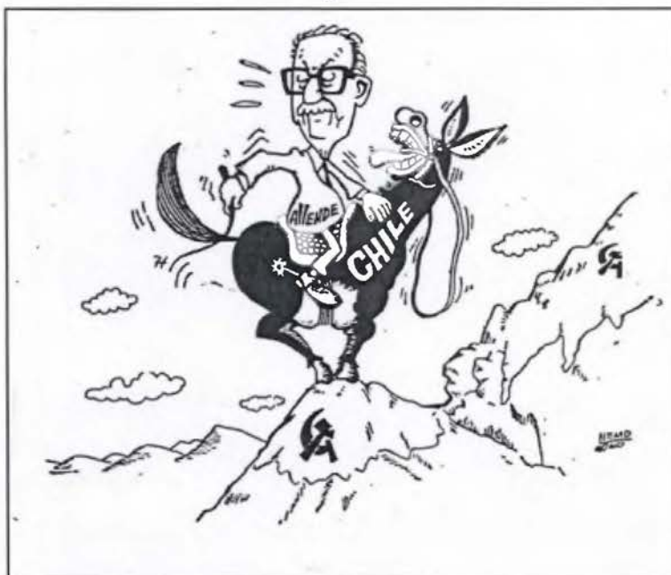
La República, miércoles 01 de noviembre de 1972, p. 8

Allende sobre el lomo de una mula que representaba un Chile incapaz de moverse, le golpea fuertemente para tratar de hacerla andar por las difíciles y escarpadas cumbres que a su vez simbolizaban la tortuosa vía al socialismo que la Unidad Popular había ofrecido como un cambio al sistema. Y es que para La República , así como para La Nación , el gobierno de la Unidad Popular en Chile era una experiencia que a toda costa debía evitarse por los males que provocaba a la economía: desabastos, carestías, retroceso en la producción. La caricatura destaca además porque la mayoría de medios en muy pocas ocasiones abordaron la realidad chilena desde esa perspectiva, salvo para el golpe militar, en cuyas noticias sí se incluyeron elementos caricaturizados de lo ocurrido.