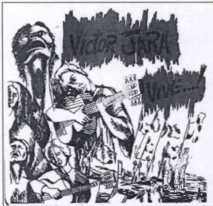
Portada del LP "Victor Jara Vive", hecho en Costa Rica. Libertad 31 de agosto de 1974, p.10

En cuanto a la posición del medio con respecto al aniversario del golpe militar, Libertad esta vez no se hace mención a la intervención estadounidense en Chile, sino que se destacaba la tortura, la persecución y el exilio de miles de personas a manos de la Junta Militar que fue calificada de fascista en esos párrafos editoriales. Y manteniendo los lazos de solidaridad y apoyo al pueblo chileno, también en el semanario de izquierda se acotaba: