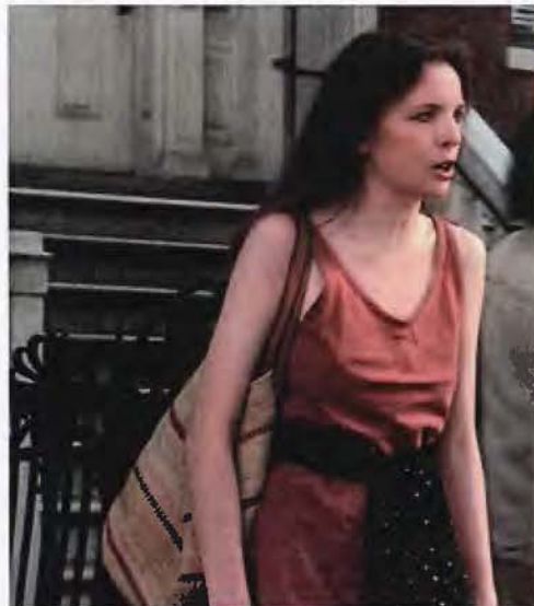
Imagen 6 Diane Keaton en Annie Hall de Woody Allen. 1979

Dicho filme y el icónico "look" de Diane Keaton, en la película Annie Hall , de Woody Allen sirven como inspiración principal para el vestuario y el estilo de Gloria.