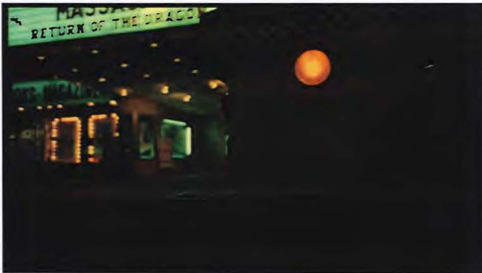
Imagen 1 Taxi Driver de Martin Scorsese. 1974

En otro episodio completamente ambientado en los años ochenta, la paleta de color será reminiscente de aquella época e incluso el formato 16:9 normal de HD cambiará por un 4:3.