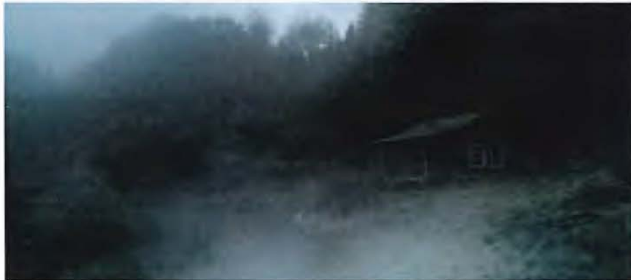
Imagen 8 Fotograma de Antichrist de Lars Von Trier. 2009

En otros episodios de características particulares, como el 12, que imita una película de terror, la búsqueda estética será justamente generar imágenes, en una locación rural, completamente adscritas a este género como el encuadre y la iluminación de la La Noche de los muertos vivientes o la atmósfera de Antichrist .