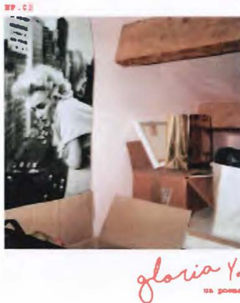
Imagen 11 Diseño de Prueba B