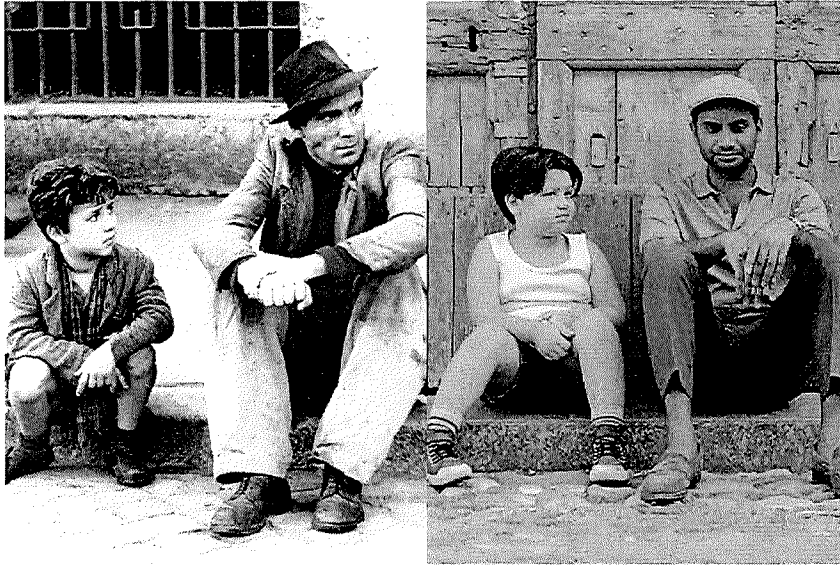
Imagen 2 El Ladrón de Bicicleta de Vittorio de Sica. 1956. y Master of None de Aziz Ansari. 2016

En el caso de Atlanta, hasta la secuencia en que se presenta la serie en cada episodio cambia dependiendo de la locación principal en la que se desarrolla el episodio.