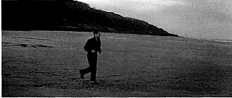
Imagen 3 Fotograma de Los 400 Golpes de François Truffaut. 1959

También, los espacios remitirán al cine o se inspirarán en películas referentes a la estética que persigue la serie. El Call Center en el que trabaja Gloria podría ser tomado de Alphaville de Godard y el propio apartamento de Gloria (y el de Pedro incluso) son referencia directa de los pequeños apartamentos de los personajes de Frances Ha de Noah Baumbach.