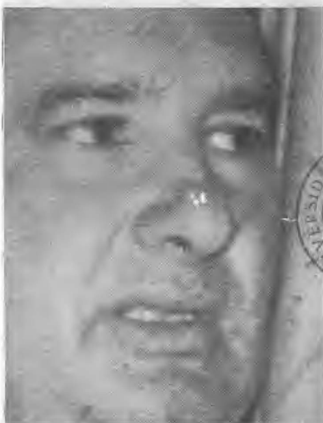
JORGE GONZALEZ MARTEN Candidato presidencial por el partido Nacional Independiente

Nació el 13 de octubre de 1926. Luego de la guerra civil de 1948, trabajó en la Dirección General de Estadística y Censos. Posteriormente estudió administración de negocios en México, pero no concluyó la carrera.