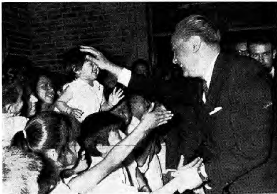
TREJOS FERNÁNDEZ EN LA ESCUELA COSTA RICA