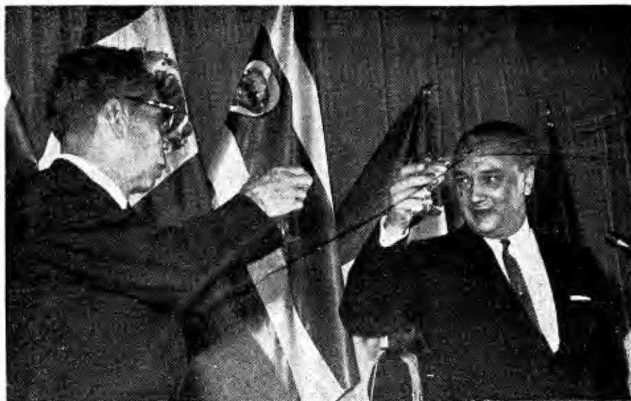
DÍAZ ORDAZ Y TREJOS BRINDAN EN EL MARÍA ISABEL "...las autoridades educativas darán las máximas facilidades..."

El día 8 a las 10 am, el presidente Trejos Fernández abordó el mismo avión que lo trajo con destino a San José de Costa Rica, acompañado de su esposa y de la misma comitiva con la que llegó. En el aeropuerto fue despedido por el presidente Díaz Ordaz, D a Guadalupe Borja de Díaz Ordaz y su gabinete.