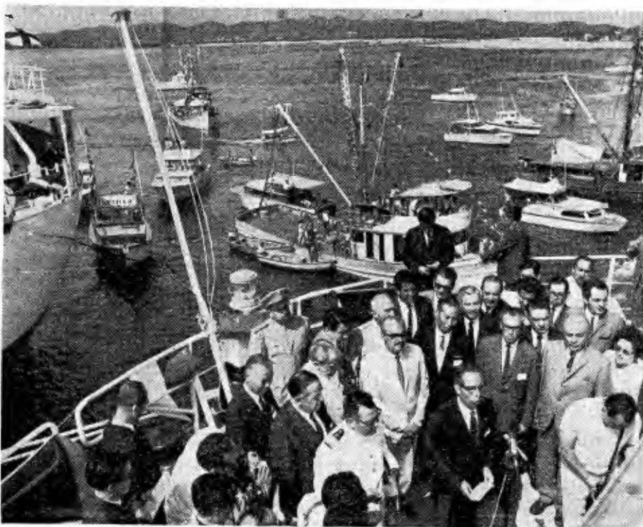
DÍAZ ORDAZ POCO ANTES DE ABANDERAR AL "MORELOS" "...debemos avivar los esfuerzos..."

Las características de los dos navíos son las siguientes: el Cuauhtémoc tiene 15,605 ton de peso muerto a calado máximo de verano, 121,277 barriles de capacidad de carga y velocidad de 15 nudos por hora; y el Morelos tiene 20,495 ton de peso muerto, capacidad para 157,012 barriles y velocidad de 15.3 nudos. Costaron, respectivamente, $38.300,00 y $45.200,000. Fueron construidos en los astilleros de Mitsui & Company Ltd , del Japón. Hacia las 3:35 pm, el presidente Díaz