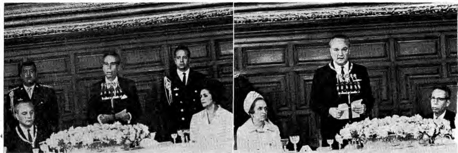
LOS PRESIDENTES DE MÉXICO Y COSTA RICA EN LA COMIDA DE PALACIO

"Mi querido Fernando —permítame que lo llame así—, usted sabe muy bien