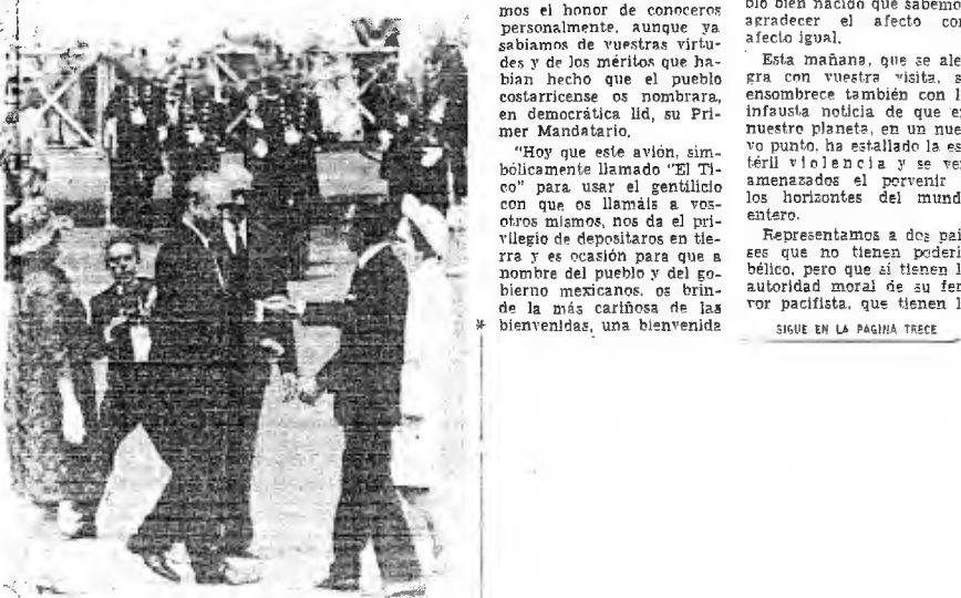
Los Presidentes de Costa Rica y México se saludan, después de oír los respectivos Himnos Nacionales. A los lados están sus esposas.