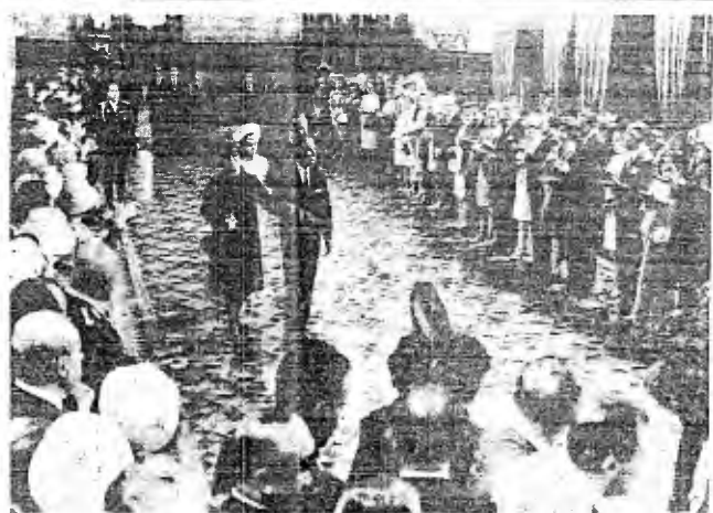
Al entrar al Salón de Recepciones del Palacio Nacional, los Presidentes Trejos Fernández y Díaz Ordaz, acompañados de sus esposas, fueron recibidos por los miembros del Cuerpo Diplomático con aplausos.