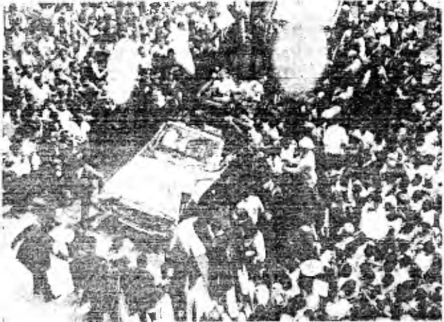
El pueblo rompió las vallas y se acercó al automóvil en el que viajaban los Presidentes de Costa Rica y México, quienes saludaron de mano a cuantos se les acercaban.

Frente al balcón central de Palacio Nacional, se reunieron más de 50,000 personas para aclamar al distinguido visitante, quien dirigió desde ese lugar, un