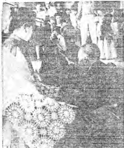
El Presidente de Costa Rica, José Joaquín Trejos Fernández, besa con devoción el Cristo que le presenta en el atrio de la Basílica de Guadalupe el Arzobispo Primado de México, Dr. Miguel Darío Miranda y Gómez.