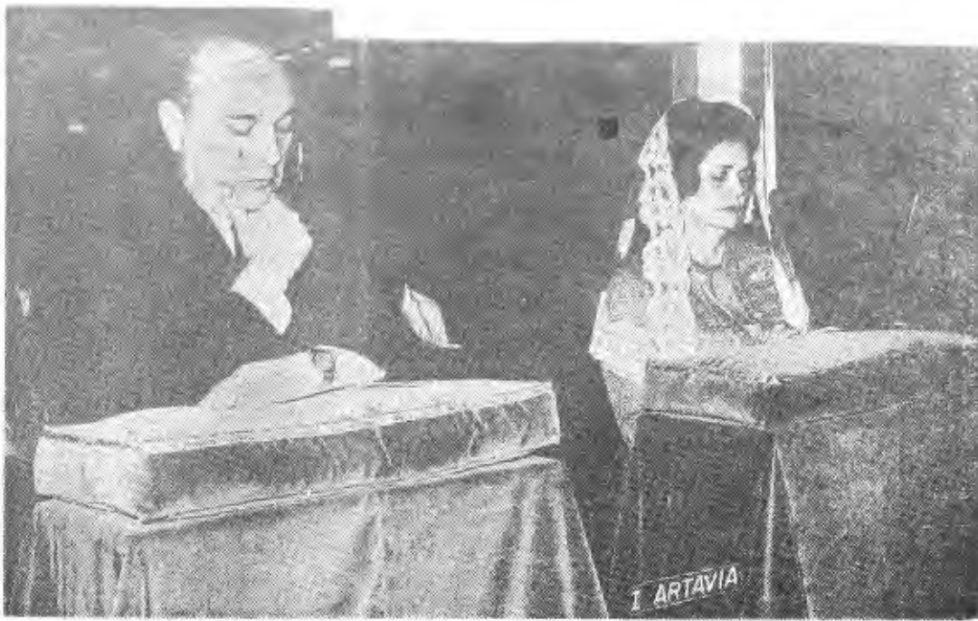
EN LA SANTA CATEDRAL METROPOLITANA. Las múltiples ocupa- ciones del Presidente jamás fueron obstáculo para sus prácticas reli- giosas... ella siempre le acompaña.

Luego el señor Expresiden- te trabajará medio tiempo en la Librería Trejos, empresa q' fundó su padre en 1916 y que hoy sigue siendo una empresa familiar. El resto del tiempo lo dedicará a ordenar papeles y a hacer apuntes con la in- tención de que puedan ser pu- blicados en libros para cona-